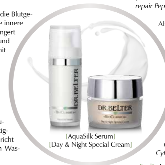
[AquaSilk Serum] [Day & Night Special Cream]

tigkeitsbooster unter das jeweilige Pflegeprodukt aufgetragen. Hauptwirkstoffe: Hyaluronsäure, Retard-Sphären beladen mit D-Panthenol, Q10, Hyaluronsäure und Vitamin-ACE Liposome, Shiitake-Immuno-Modulator, Baobab-Hibiskus-Komplex, Glucolift-Komplex, Goldener Seetang, vegane Seidenproteine, Cyto-repair Peptid, Ginseng Bio Extrakt, Ginkgo Bio Extrakt